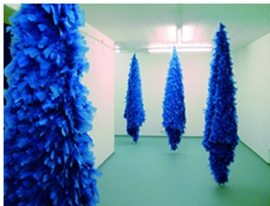
Timur Lukas & Laurentius Sauer, 'Due Two Fries', Ausstellungsansicht

Timur Lukas & Laurentius Sauer, 'Due Two Fries', Kunsthalle Memmingen, 16.3. – 10.10.2021