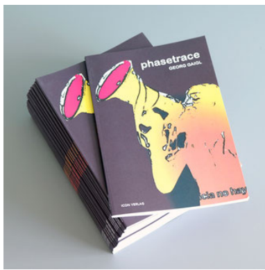
Georg Gaigl, Buchcover, 2020