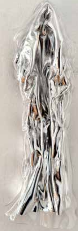
Madonna (Silver 5) 2021 47,5 x 12 cm Kunststoff 750,-