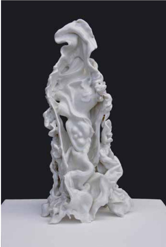
figurine II, 2020 glasiertes Porzellan 45 x 23 x 23 cm 3.200,-