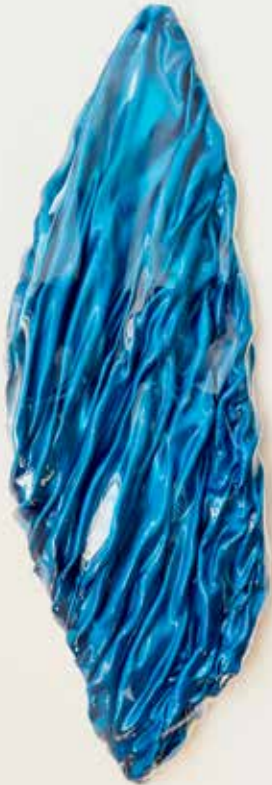
Liquid (Blue) 2021 71 x 25 cm Kunststoff 1.200,-