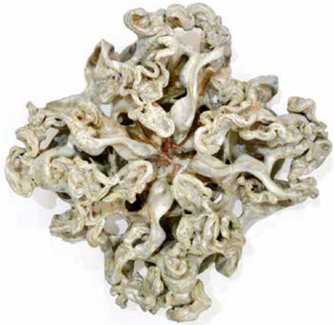
cross II, 2019 glasierte Keramik 43 x 43 x 16 cm 3.500,-