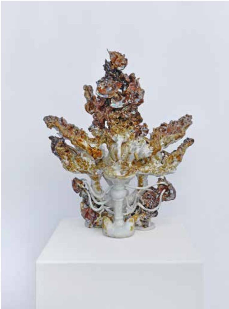
fountain, 2020 glasierte Keramik 50 x 22 x 55 cm 4.500,-