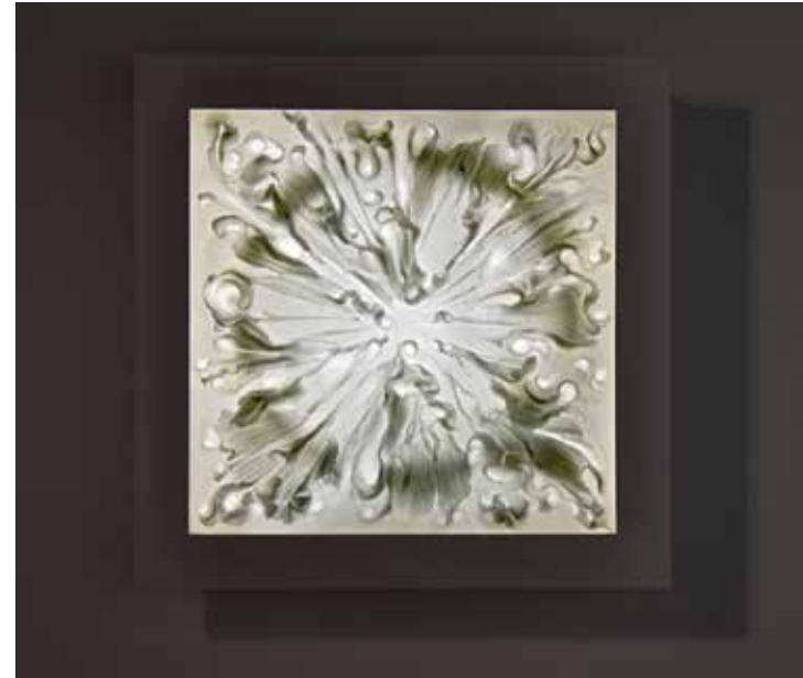
sphere IV, 2016 Bullseye-Glas opaque, sandgestrahlt, LED-Beleuchtung, lackierter Holzrahmen 64 x 64 x 9,5 cm Je 5.600,-