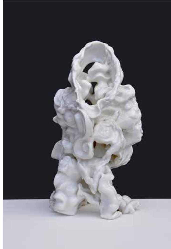
figurine V, 2020 glasiertes Porzellan 41 x 15 x 16 cm 2.600,-